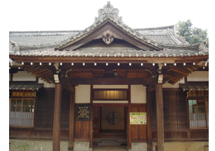
日本統治時代の嘉義神社

第二の都市・高雄、近代台湾の古都・台南、日本と関わり深い嘉義など、みどころも多くあります。