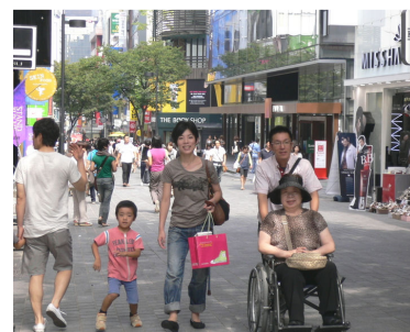
車椅子での家族旅行(ソウル・明洞)

お一人お一人の旅への想いを大切に、皆様にとって、かけがえのない旅行を、一つ一つ 手作り、企画・手配しております。