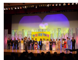
チャリティーコンサート

その他、個人様の韓国旅行にて、オーダーメイドでの手配、福祉車両の手配による車椅子 でのご旅行、韓国各地方への観光、企業視察、現地での音楽文化交流など、多数手がけて おります。