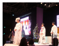
アジアブライダルサミット